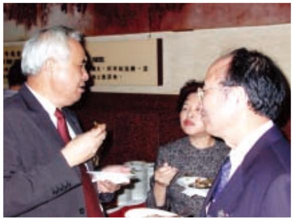
2004 年總統就職慶祝酒會

政治人物會優先思考自己的利益，政黨利益次之，國家與社會利益反而會排在最後。國會議員當然優先考慮自己的政治版圖，他們背負選票的壓力，為了選民，他們有可能做出不利於國家社會的決定。教育部就是